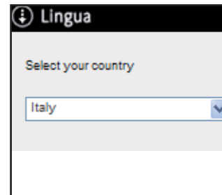
Fig. 2 - Selezione Lingua